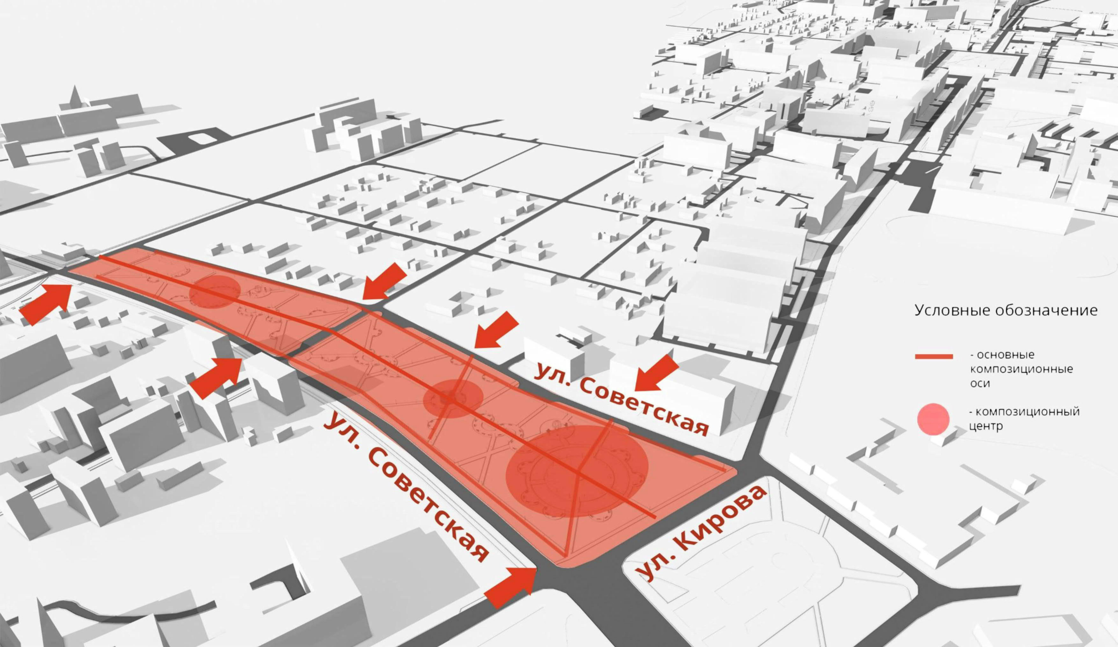
Схема градостроительного анализа

Сквер «Молодежный бульвар» (Сквер по ул. Советская)